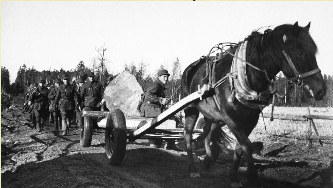
Финская инженерная часть направляется на сооружение противотанковых заграждений на Карельском перешейке (участок одной из полос обороны Линии Маннергейма), осень 1939 года. На переднем плане на подводе — гранитная глыба, которая будет установлена в качестве противотанкового надолба.

Успех Финляндии был связан, в первую очередь, с тем, что советские войска были привязаны к дорогам. Двигавшиеся же небольшими мобильными отрядами финны легко отрезали технику и людей от необходимых коммуникаций. 8-я армия отступила, потеряв людей, но до самого конца войны не оставляла этот регион.